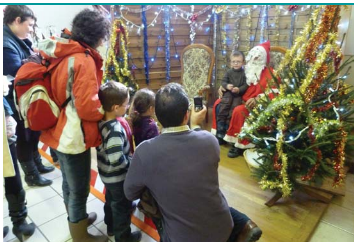
Le Père Noël était présent pour la photo avec les enfants.