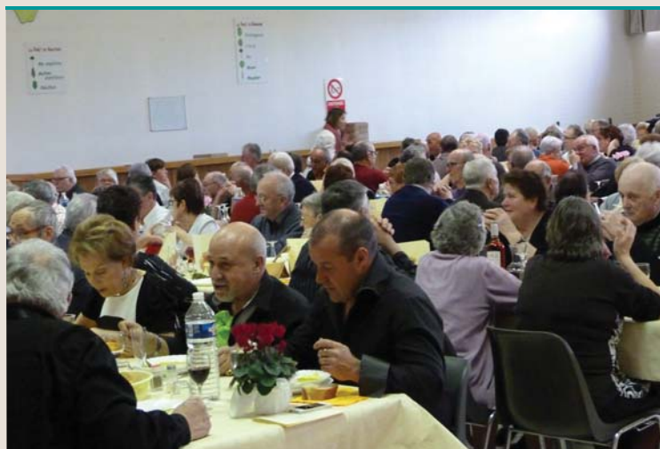
Plus de 240 personnes au repas organisé par la Municipalité.

Plus de 240 personnes au repas organisé par la Municipalité. Un moment de convivialité et d'échanges appréciable pour tous.