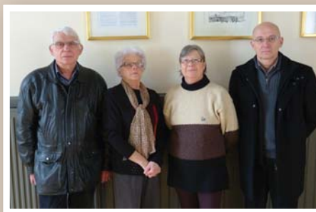
Les agents du recensement page 7