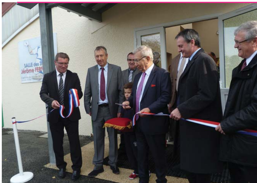
L'inauguration de la première tranche des travaux de réaménagement du bourg..

Saint-Aulaye manifeste son désir de se développer, d'attirer une nouvelle population. Un constat qui ne trompe pas : la fréquentation scolaire est en nette augmentation. Maintenant, il faudrait que des structures d'accueil touristiques soient créées à la mesure des enjeux qui se profilent.