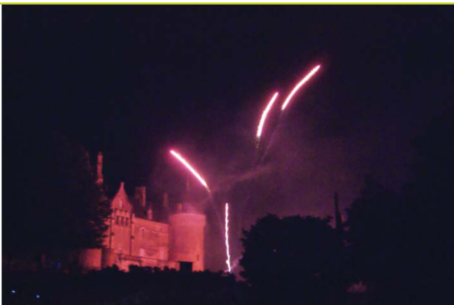
Feu d'artifice face au château.

La fête locale se déroulera du vendredi 10 au dimanche 12 mai 2013. Plusieurs animations sont prévues grâce à la collaboration des associations (Eulalie Festif, Club de Pétanque, Double Jeux) et de la municipalité.