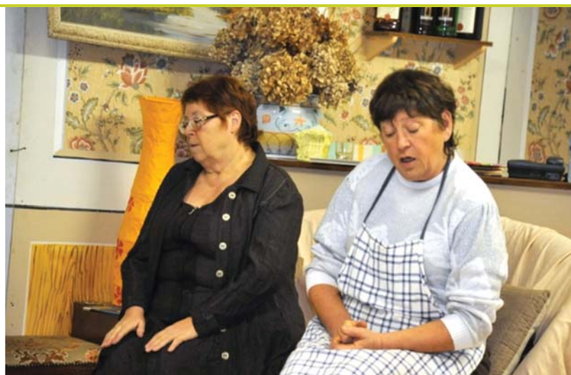
Répétition de la pièce « Recherche femme désespérément ». (photo de J.L. SAVIGNAC)

Infos : 05 53 90 84 33 – biblio-staulaye@wanadoo.fr - staulaye.over-blog.com