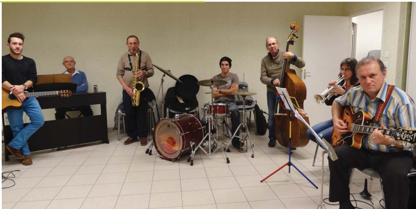
Le groupe d'improvisation.