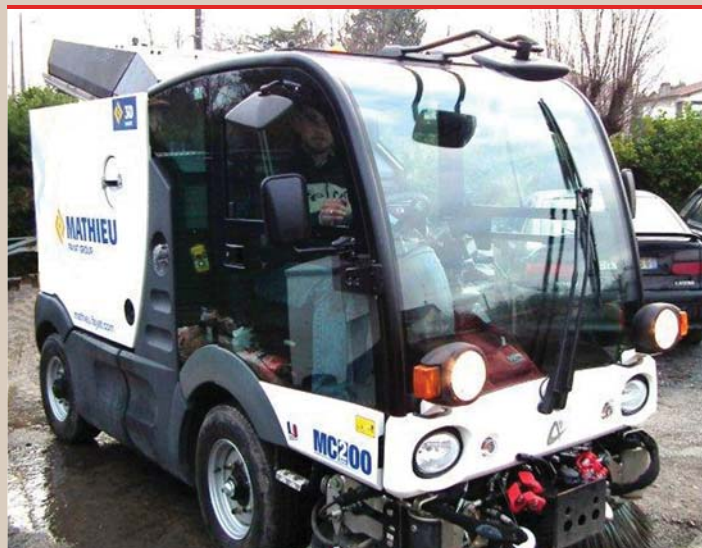
La nouvelle balayeuse.

Indispensable pour le maintien de la propreté des de la voirie, la nouvelle balayeuse a pris ses fonctions depuis le mois de janvier. La municipalité a acquis ce matériel à la société 3D MATHIEU, pour un montant de 79 000 € HT. La balayeuse est polyvalente : elle peut être équipée d'une lame de déneigement ou saler les routes. Elle est garantie 2 ans pièce et main d'œuvre. Quatre agents des Services Techniques ont été formés par la société 3D MATHIEU durant 2 jours.