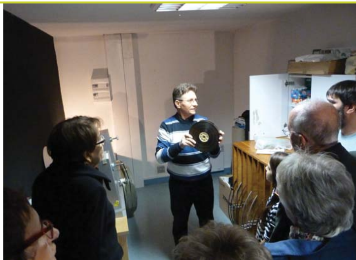
De la pellicule au projecteur numérique, le cinéma évolue.