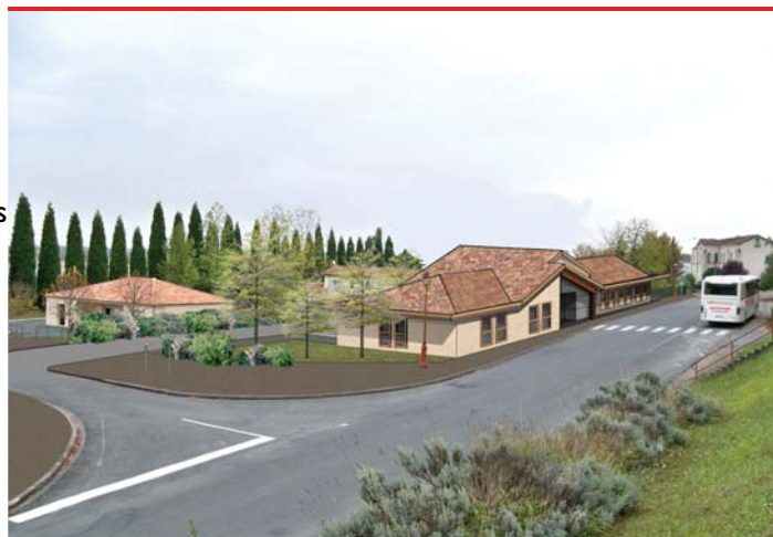
La future maison de santé.

Comme de nombreux territoires ruraux, le Pays de Saint-Aulaye est aujourd'hui menacé par un risque de pénurie de médecins. En effet, nos praticiens sont tous proches de la retraite et trouver des successeurs n'est pas chose aisée. L'enjeu est d'importance donc pour la population mais aussi pour le Centre Hospitalier qui a besoin de médecins. L'élaboration du projet sur lequel les élus et les professionnels travaillent depuis plus de 2 ans est terminée. Ce projet a été bien reçu par l'Agence Régionale de Santé et par les services de l'Etat, du Département et de la Région. Le coût total de l'opération est de 602 849 € HT, dont 36% (264 000 €) restant à la charge de la Communauté de Communes. Le Cabinet d'Architecture Marty et le bureau d'étude Cesti ont, avec les élus et les professionnels de santé, prévu un bâtiment de 350 m 2 , rue du Moulin, à proximité immédiate du Centre Hospitalier. Le permis de construire a été accordé le 16 mars 2013, et les travaux devraient débuter en juin pour une livraison début 2014.