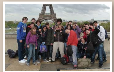
Le Point Accueil Jeunes page 10