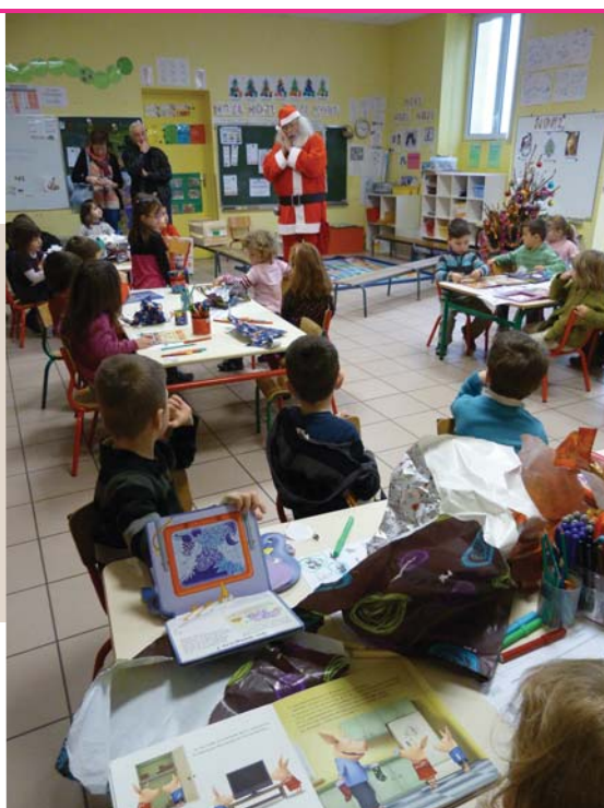
Le Père Noël à la Maternelle.