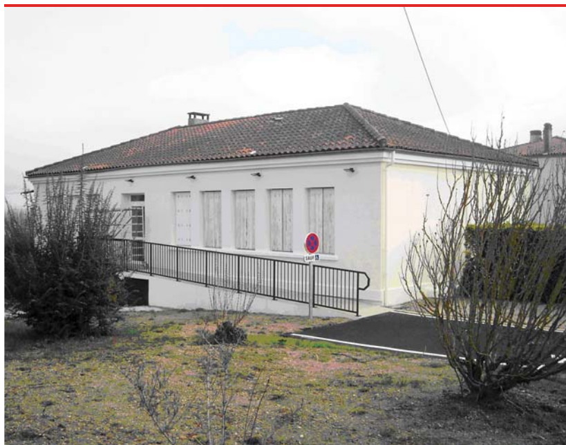
Le nouveau Centre Médico social, rue du Dr Ladouch.

Par la suite, des partenaires du Conseil Général y tiendront leurs permanences, ou rendez vous.