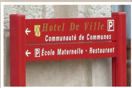
Une nouvelle signalétique sur la commune - page 7