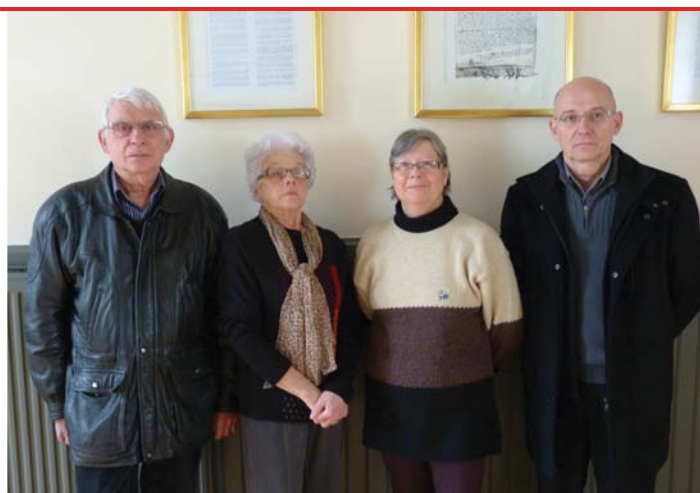
Les quatre agents recenseurs ont parcouru le territoire eulalien.