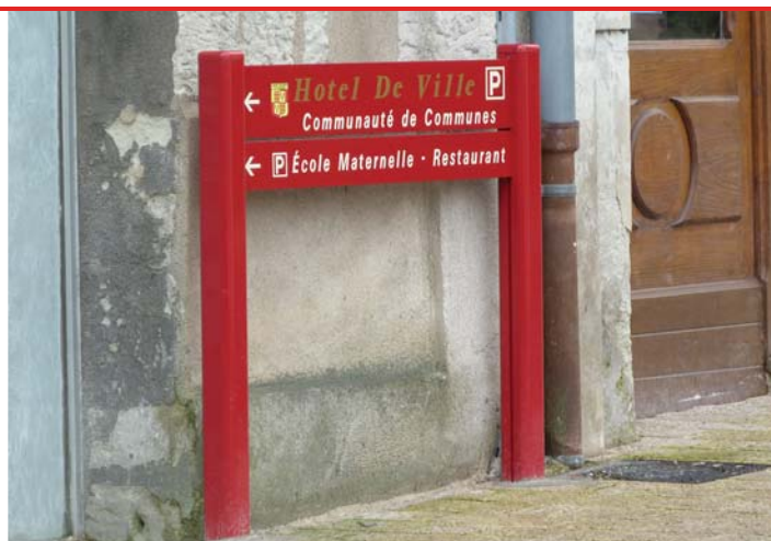
La nouvelle signalétique de la ville.

Une nouvelle signalétique très reconnaissable grâce à sa couleur rouge, a été mise en place sur la commune suite aux travaux du bourg. C'est la société « Equip'Urbain » qui a été retenue pour un montant de 9 613,66 € HT. Ces nouveaux panneaux permettent de mieux se situer dans la commune et ainsi diriger le public vers les structures publiques, le patrimoine et les entreprises eulaliennes.