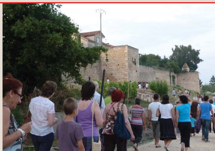
La flânerie médiévale organisée par l'office de tourisme.

Infos : Point Accueil Jeunes Place Pasteur – 24410 Saint-Aulaye 05 53 91 86 37 - 06 76 48 36 69