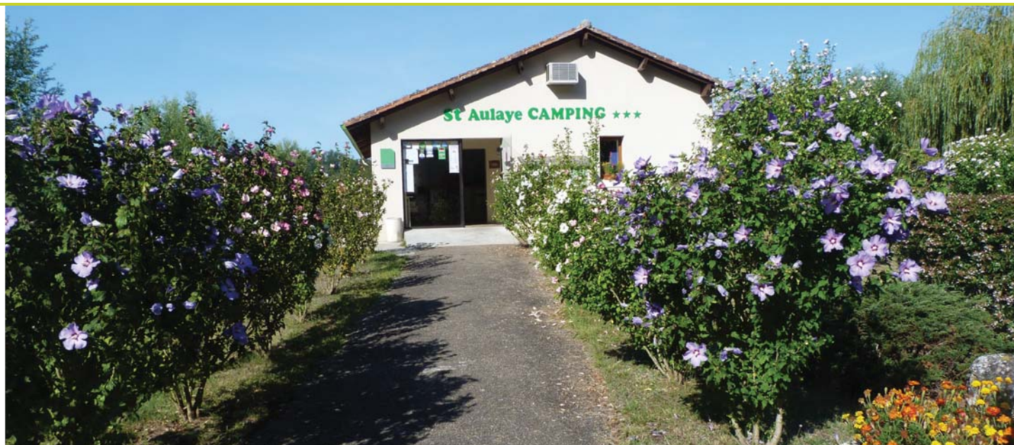
Le camping de Saint-Aulaye.