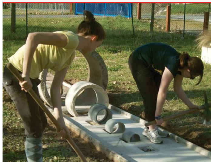
Le Chantier Jeune du mini golf réalisé en 2012 par le Point Jeunes

Cette année 2012/2013 deux séjours ont été organisés, l'un au ski dans le Cantal, l'autre en Espagne à Barcelone. Particulièrement conscient de la mission éducative de la structure, l'équipe d'animation s'est également lancée dans un défi citoyen avec les jeunes en mettant en place des opérations « chantiers jeunes ». Le principe de ces